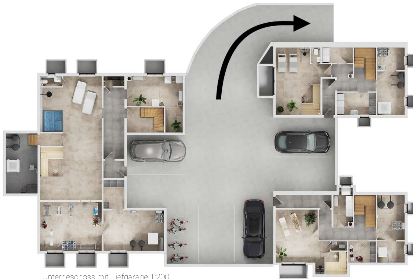
Untergeschoss mit Tiefgarage 1:200

Drei mögliche private Stellplätze und ein gemeinschaftlicher Fahrradabstellbereich garantieren die Sicherheit Ihrer Fahrzeuge. Durch eine Schleuse gelangen Sie direkt und trockenen Fußes in das Treppenhaus zum eleganten Eingangsbereich im Erdgeschoss.