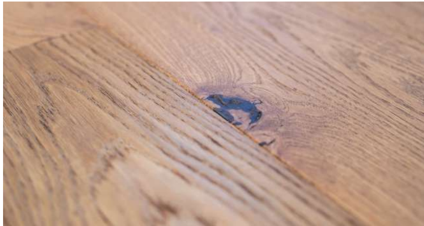
Luxuriöse Böden z.B. aus Eiche, handgehobelt und geölt

In bester Lage in Waldtrudering leben Sie Tür an Tür mit erfolgreichen Geschäftsleuten, Prominenten und Familien. Sie alle wissen die Exklusivität und Zurückhaltung der ausgezeichneten Lage zu schätzen: Der Zeisigweg 17, Ihre neue Heimatadresse, liegt nur rund 10 Kilometer vom Marienplatz entfernt. Mit dem Auto, den öffentlichen Verkehrsmitteln und selbst dem Fahrrad erreichen Sie in kürzester Zeit die Büros der etablierten und innovativen Unternehmen der Stadt, die edlen Boutiquen an der Maximilianstraße und die exklusiven Restaurants der besten Köche weltweit. Für Ihre erholsame Auszeit im Alltag können Sie das Auto sogar in der Garage stehen lassen. Das beruhigende Grün des Waldes haben Sie aus vielen Räumen des Hauses im Blick: Vom Wohnzimmer, am Esstisch, aus der Küche und vom Schlafzimmer beobachten Sie den entspannenden Lauf der Jahreszeiten und entdecken das ein oder andere Reh. Dank dieser Lage werden Joggen oder Spazieren zum festen Bestandteil Ihres lebenswerten Alltags.