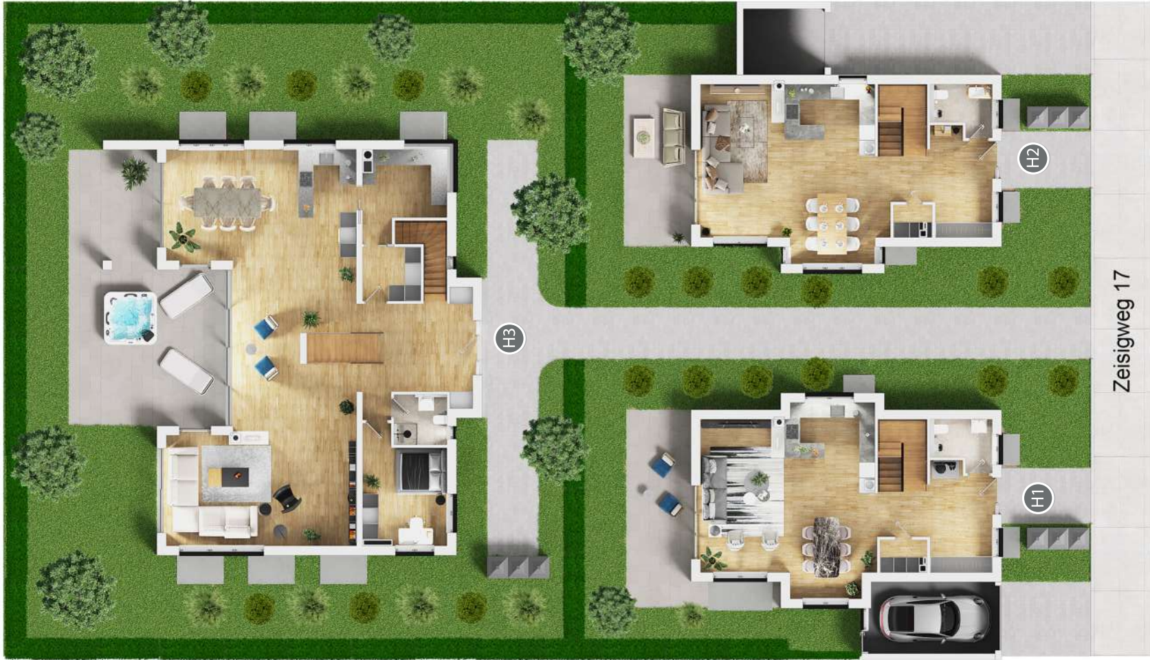
Umriss Erdgeschoss 1:200